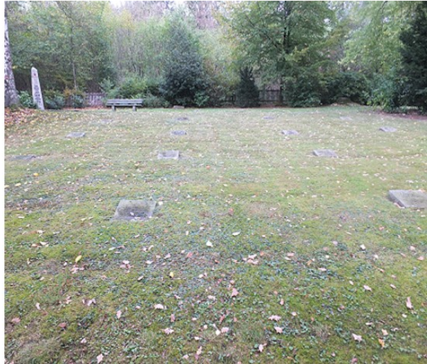
Kein Geburts- oder Todestag, unleserliche Beschriftungen, Kissensteine und keine Wege im Winter 2018 und Herbst 2020 in Meschede