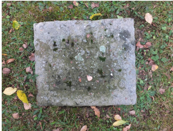
Grabstein für Twitalka Stadnik und Anna Tscherewko auf Meschedes Waldfriedhof, Oktober 2020 17

Es gibt viele Grabsteine, auf denen die Geburts- und Sterbetage fehlen, wie sie vom „Gräbergesetz“ vorgeschrieben sind. Dort steht in Paragraph 2 Absatz 6: „... Auf dem Grabzeichen sollen in gut lesbarer, dauerhafter Schrift mindestens Vor- und Familienname, Geburts- und Todestag des Bestatteten, bei Ausländern auch die Staatsangehörigkeit angegeben sein.“ 16 Jeder, der schon einmal in einem Archiv oder einer Datenbank nach einem Toten gesucht hat, weiß um die Wichtigkeit des Geburts- und Sterbedatums – sowohl, um schneller fündig zu werden als auch, um Verwechslungen auszuschließen zu können.