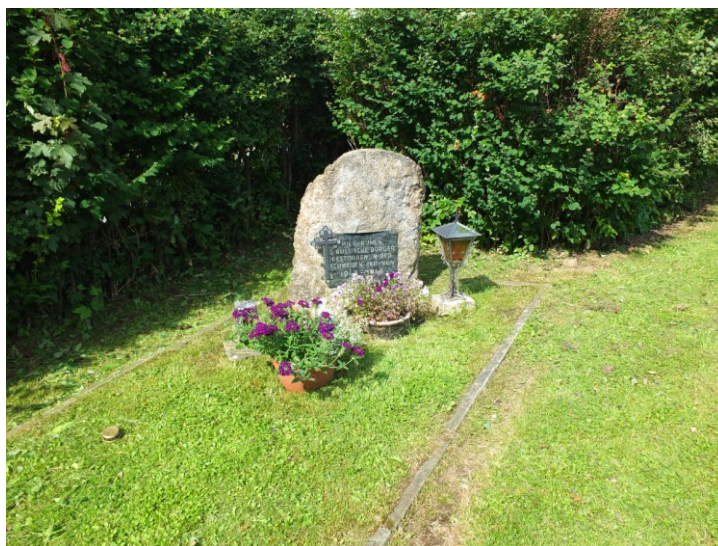
„Hier ruhen 6 russische Bürger, gestorben in der schweren Zeit von 1943-1945“ 12